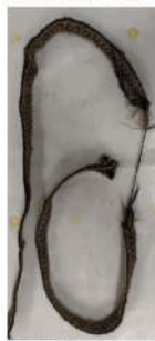
Amostra após ensaio