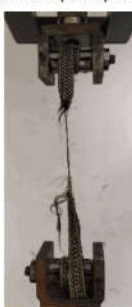
Amostra após ruptura